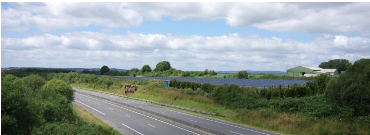
Figure 6 : Vue du site du projet depuis le pont, avec l'application de mesures

Le projet prévoit la plantation d'arbustes à hauteur dégressive sur le tronçon sud-est du site d'implantation, en avant de la clôture, afin de créer une courbe visuelle qui souligne esthétiquement la présence du projet depuis ce point de vue (cf figure 6).