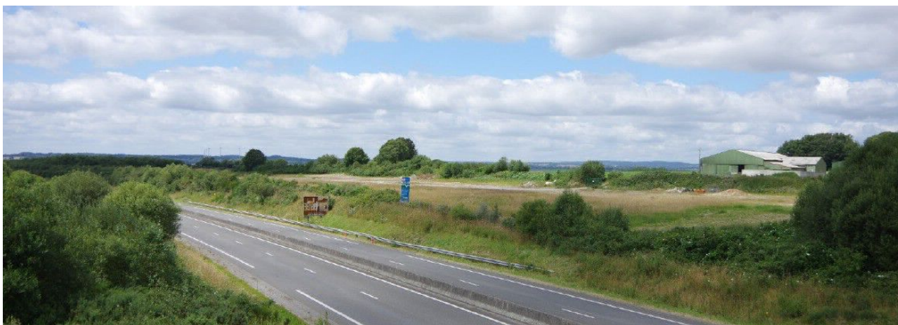
Figure 5 : Vue actuelle du site du projet depuis le pont traversant la RN 164 à l'extrémité est de la zone

Le site de projet est implanté sur une plateforme enclavée entre la RN 164 au sud et la RD 76 au nord. Il se trouve en hauteur par rapport à la RN 164 et la végétation occupant les talus de celle-ci est dense, masquant les vues sur le projet. Au-delà des abords immédiats, la trame végétale et les boisements caractéristiques du paysage bocager limite les perspectives sur le projet. En particulier, le site n'est pas visible des hameaux à proximité. Quelques percées ponctuelles existent, en particulier au niveau des entrées et depuis le pont enjambant la RN 164 et le projet. Les photomontages réalisés depuis ces points de vue ne montrent pas une perception visuelle importante du parc mis à part depuis le pont (cf figure 5 et 6 ci-dessous).