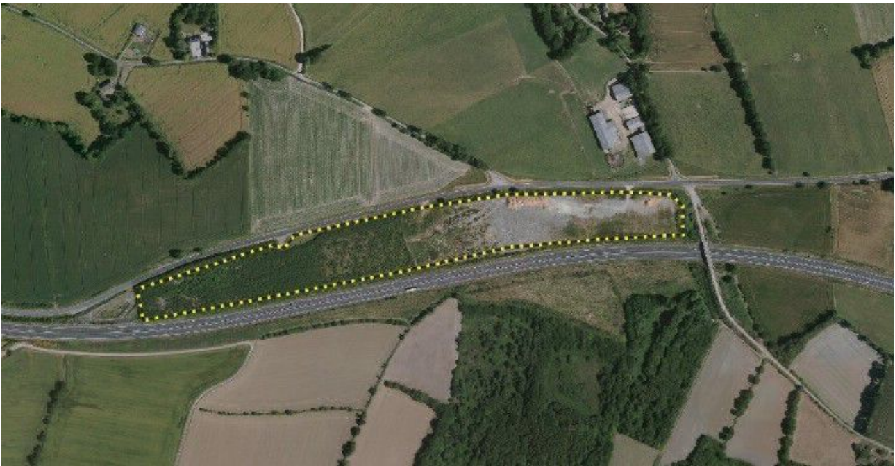
Figure 2 : Zone d'implantation potentielle du projet

Le projet de centrale solaire photovoltaïque occupera un terrain d'environ 6 hectares. Il sera composé de 407 tables photovoltaïques 2 . Ces tables seront installées parallèlement les unes aux autres et orientées vers le sud. Positionnées à 70 cm au-dessus du sol, elles reposeront sur des pieux battus et totaliseront une surface projetée d'environ 3,13 ha. Le haut des panneaux sera à 3 m de hauteur maximum, et les tables seront espacées de 2,20 m environ, pour laisser circuler l'eau de pluie.