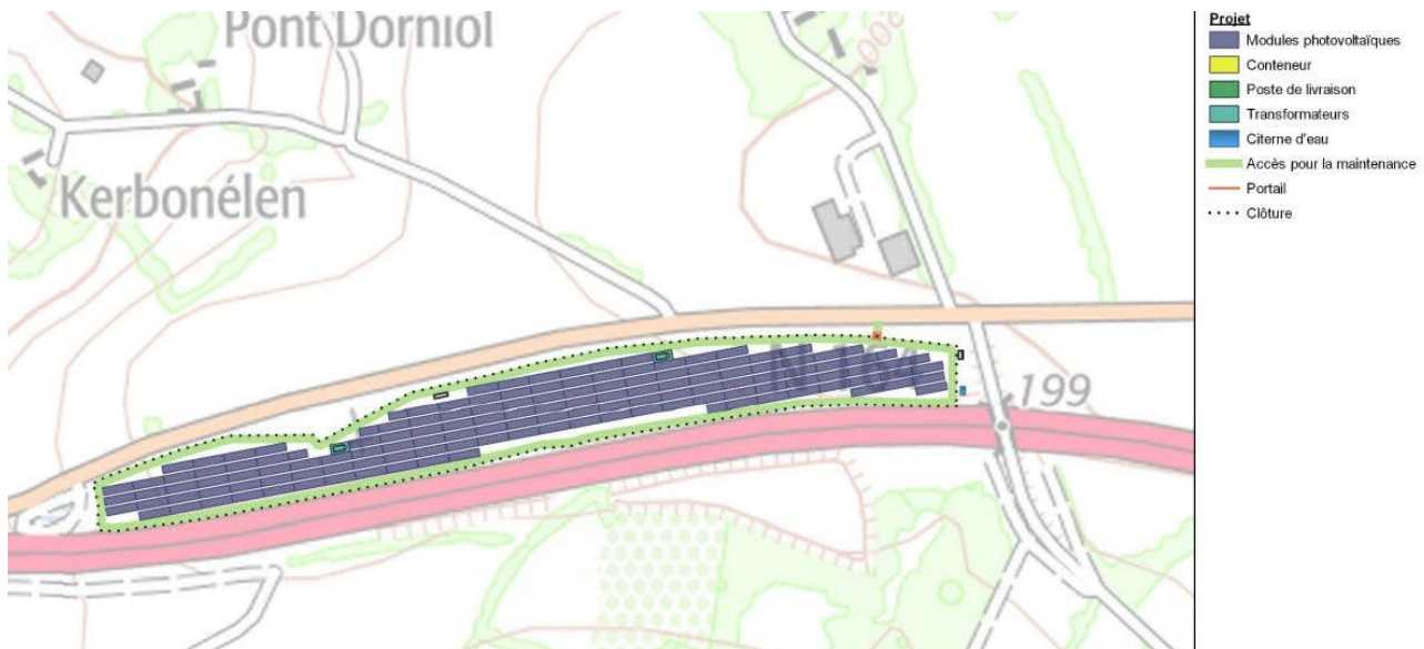
Figure 3 : Plan des installations

Le projet de centrale solaire photovoltaïque occupera un terrain d'environ 6 hectares. Il sera composé de 407 tables photovoltaïques 2 . Ces tables seront installées parallèlement les unes aux autres et orientées vers le sud. Positionnées à 70 cm au-dessus du sol, elles reposeront sur des pieux battus et totaliseront une surface projetée d'environ 3,13 ha. Le haut des panneaux sera à 3 m de hauteur maximum, et les tables seront espacées de 2,20 m environ, pour laisser circuler l'eau de pluie.